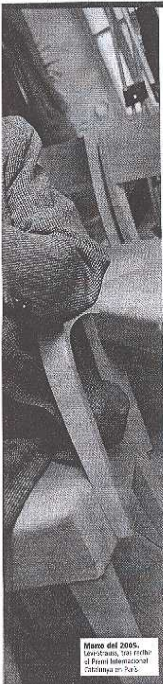
Marzo del 2005. Lévi-Strauss, tras recibir el Premi Internacional Catalunya en París

La destrucción simultánea de las diferencias culturales y de la diversidad natural nos acerca a la entropía. Sin diferencias ni diversidad desaparece lo que es más genuino de la especie humana, la cultura. Eso fue el mensaje que Lévi-Strauss expresaba brillantemente en el último volumen de las Mitológicas lo que fue repitiendo muchas veces de formas diferentes. La última vez que yo recuerdo haber oído este mensaje de su voz fue en el discurso de recepción del Premi Internacional Catalunya que le ofreció la Generalitat en el 2005. ●